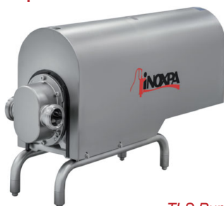
TLS Pumpe mit Motorabdeckung